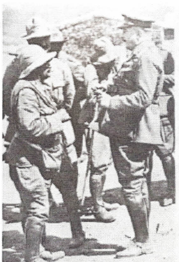
Primo de Rivera visita las tropas españolas en Marruecos.